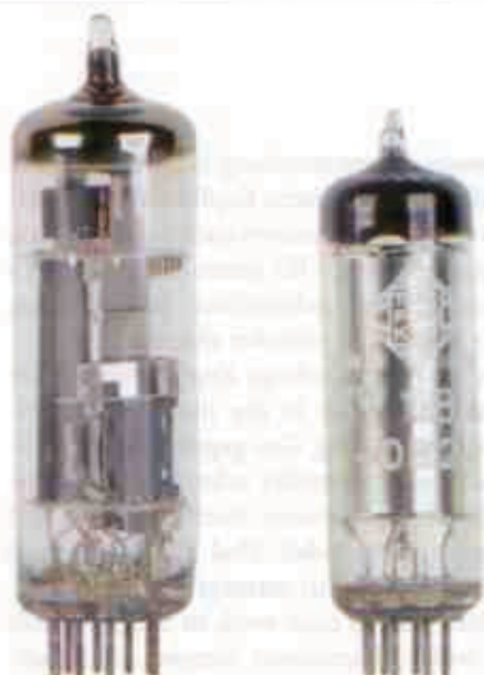
Links die Signalaröhre PCL86, rechts die Stabilisatorröhre STV 108/30

Von Eternal-Arts-Verstärkern sind wir's gewohnt, und der Kopfhörer-Amp macht da keine Ausnahme: Totenstille. Ohne Signal am Eingang herrscht absolute Ruhe auf den Ohren, bei Anschluss einer Signalquelle hört man deren Rauschen und Brummen – sonst nichts. Wie Burkhardt Schwäbe das bei Röhrengeräten mit eingebautem Netzteil immer wieder hinbekommt, verdient allerhöchsten Respekt.