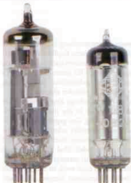
Links die Signalröhre PCL86, rechts die Stabilisatorröhre STV 108/30