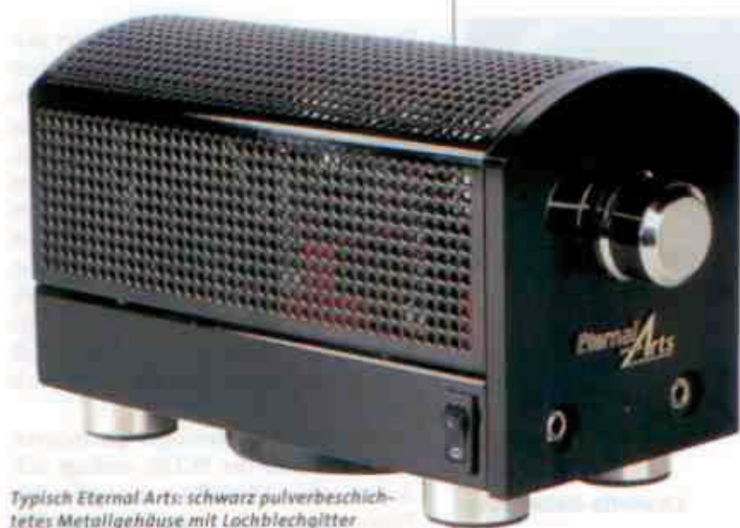
Typisch Eternal Arts: schwarz pulverbeschichtetes Metallgehäuse mit Lochblechglitter

Wie bei Eternal Arts üblich, geriet die Typenbezeichnung spartanisch bis nicht existent: Die Maschine heißt schlicht „OTL-Kopfhörerverstärker“ und kostet nicht ganz so schlichte 2.750 Euro. Dafür gibt's ein piekfein glänzend schwarz gepulvertes Gehäuse mit sanft gerundetem Lochblechdach, einem Paar Cinch-Eingänge, einem satt laufenden Pegelsteller und zwei Klinkenbuchsen zum Anschluss zweier Kopfhörer. Dabei allerdings gibt es ein paar Besonderheiten zu beachten: Das Gerät kommt nicht mit jedem Kopfhörer zurecht, und schon mal gar nicht mit zweien davon im Parallelbetrieb. Der Grund dafür ist einsichtig und im Kürzel „OTL“ verborgen: Die Schaltung ist ein Röhrenverstärker ohne Ausgangsübertrager (output transformerless) und kann von daher nur eine begrenzte Menge Strom liefern. Wir erinnern uns: Bei üblichen Röhrenverstärkern dient jener Übertrager der Energietransformation aus dem Röhrenuniversum (hohe Spannungen, geringe Ströme) in die Lautsprecherwelt (geringe