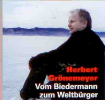
Herbert Grönemeyer Vom Biedermann zum Weltbürger

KEF, KLIPSCH, AVM, VELODYNE, REGA, AUDIOLAB