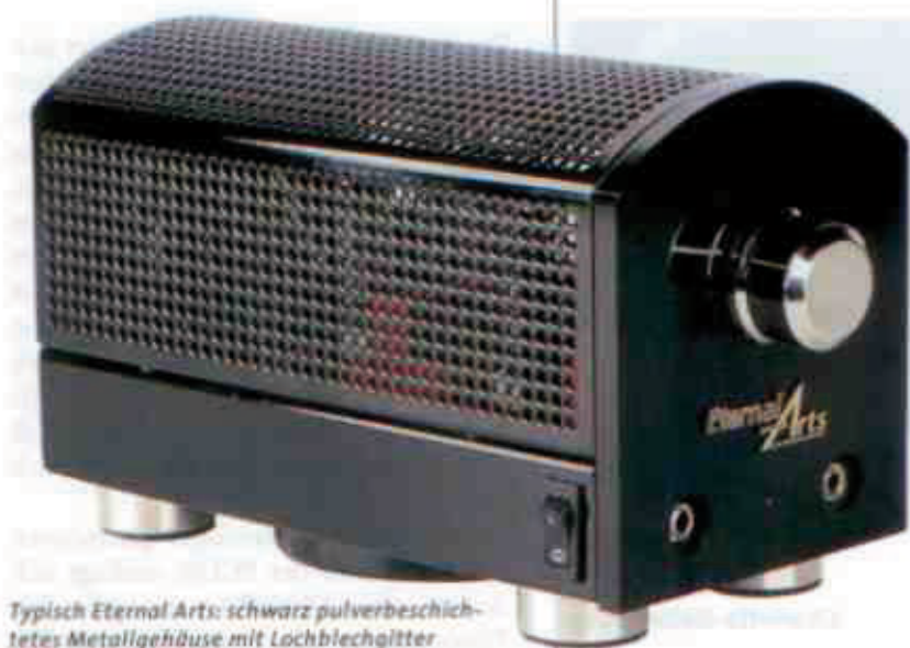
Typisch Eternal Arts: schwarz pulverbeschichtetes Metallgehäuse mit Lochblechgitter

Wie bei Eternal Arts üblich, geriet die Typenbezeichnung spartanisch bis nicht existent: Die Maschine heißt schlicht „OTL-Kopfhörerverstärker“ und kostet nicht ganz so schlichte 2.750 Euro. Dafür gibt's ein piekfein glänzend schwarz gepulvertes Gehäuse mit sanft gerundetem Lochblechdach, einem Paar Cinch-Eingänge, einem satt laufenden Pegelsteller und zwei Klinkenbuchsen zum Anschluss zweier Kopfhörer. Dabei allerdings gibt es ein paar Besonderheiten zu beachten: Das Gerät kommt nicht mit jedem Kopfhörer zurecht, und schon mal gar nicht mit zweien davon im Parallelbetrieb. Der Grund dafür ist einsichtig und im Kürzel „OTL“ verborgen: Die Schaltung ist ein Röhrenverstärker ohne Ausgangsübertrager (output transformerless) und kann von daher nur eine begrenzte Menge Strom liefern. Wir erinnern uns: Bei üblichen Röhrenverstärkern dient jener Übertrager der Energietransformation aus dem Röhrenuniversum (hohe Spannungen, geringe Ströme) in die Lautsprecherwelt (geringe