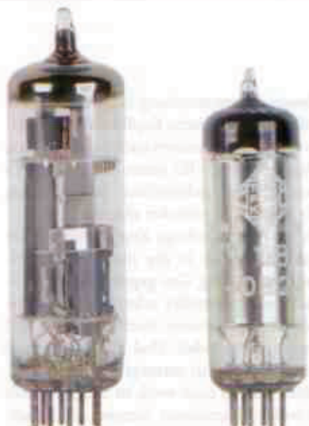
Links die Signalröhre PCL86, rechts die Stabilisatorröhre STV 108/30