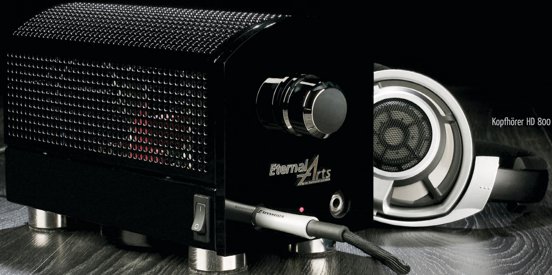
Kopfhörer HD 800